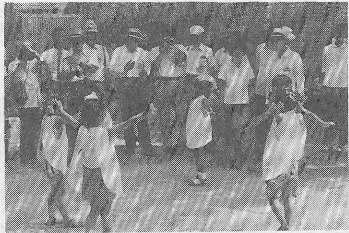
園児の遊戯を見る (西安市第4紡績工場幼稚園で)