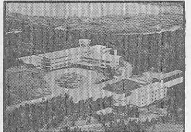
雄大な芦の湖と美しい湖尻高原