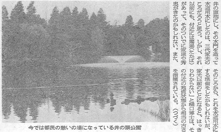
今では都民の憩いの場になっている井の頭公園