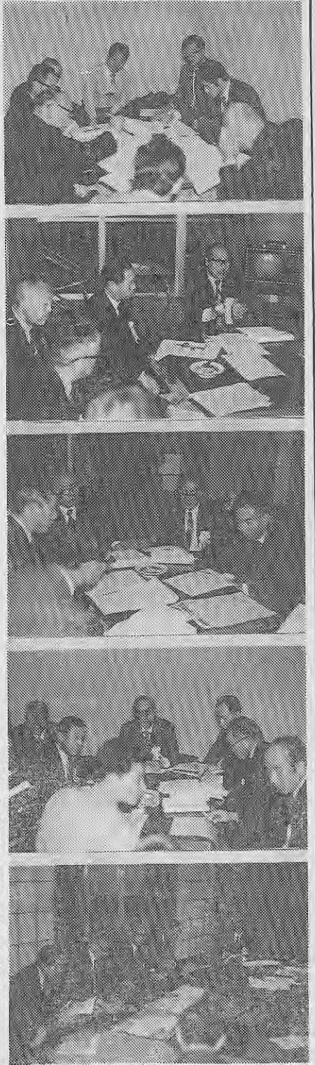
総会のなかでも地区会議は重要な地位を占める。真剣な表情で審議検討がつけられた。写真上から北海道・東北・関東・東海・北陸・近畿、中四国・九州の地区会議。