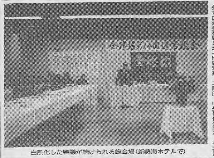
白熱化した審議が続けられる総会場(新熱海ホテルで)

新幹線事故にもかかわらず参加者は刻々の高まりを見せ、午後二時三十分からは総会を開始した。