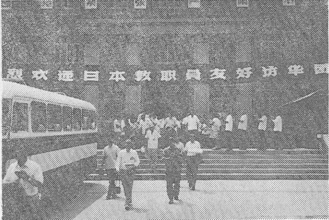
あざやかな引き幕の下で訪華団を見送る西安市第83中学の教職員と生徒。

二、中国を視るにつれて、日本社会の現状が、中国の発展と比べて、遅れていることに気づいた。中国の発展は、中国の歴史や文化の豊かさを生かしている。中国は、長い歴史を持ち、豊かな文化を有している。その歴史や文化を学ぶことは、日本人にとり大変な利益をもたらしている。