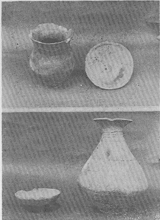
水沼出土で上が「こしき」下は「つぼとはち」いずれも樽式(群馬大学蔵)

【西から来た弥生の文化】群馬県では縄文式文化の遺跡は、県下いたるところで見られ、遺物も多く、研究もかなり進んでいるといえる。しかし弥生式文化の遺跡については必ずしも多いとはいえない。 これは前者が五千年にもおおよしい期間の人間の営みであり、縄文式土器は、しかも全国に普遍して発見されているのに対し、後者は全国的に見てもB・C三百年前後からA・D四百年前後にわたる僅々約七百年間の生活記録であり、弥生式土器の分布は、西日本から近畿地方にかけても密度が高くなり、関東から東北へ進むにしたがって密度が低くなっていくことに起因すると考えられる。 だが、近時国士開発チームによる遺跡は、群馬県多野郡赤城村大字樽山(分布図の7)にあり、関東地方の弥生式文化後期の標準遺物として認められ、出土土器は、方から流れ来たことは確実である。