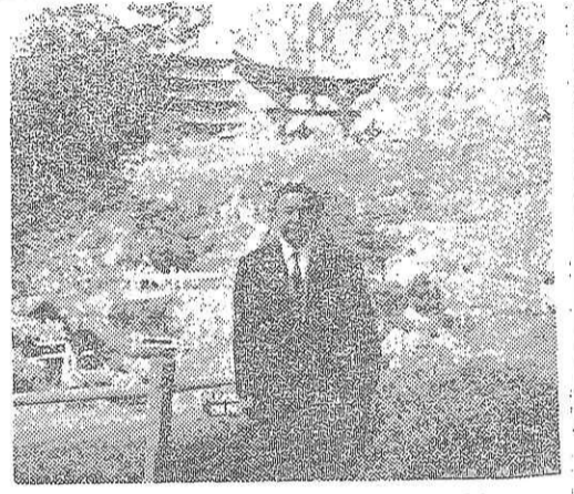
ロシアにある日本人の庭園。鳥居や五重塔もみえる。立っているのは筆者。