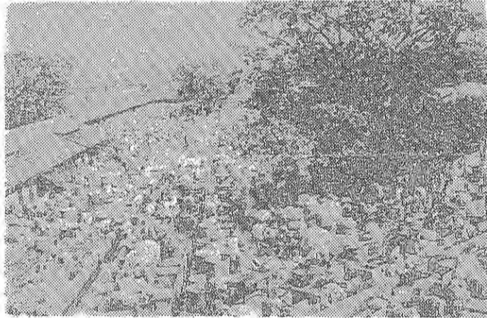
ホノルルの市営洗濯場

ホノルルの市営洗濯場 ホノルルの市営洗濯場 ホノルルの市営洗濯場 ホノルルの市営洗濯場 ホノルルの市営洗濯場