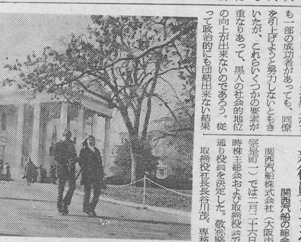
ホワイト・ハウスの前で。左端が筆者。

不徹底な黒人教育 アメリカはハワイからワシントンまで十日間あったが、何と言っても黒人問題がこれら解決しなければならぬ最大の課題である。ニューヨークの黒人街を回ったが車から降りられなかった。また、危険も時としてある。また、危険も時としてある。