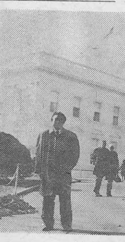
ドム、その頂上に約六分の自由の神の像がある。

ドム、その頂上に約六分の自由の神の像がある。ドムの下の大広間は大統領の就任式で、天井や周囲の壁は建国の歴史に題材をとっている。その日はちょうど上下院がともに開会されていて、本会議の様子を参観出来たことと