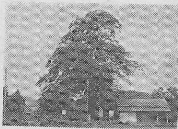
美都郡府町の行に於いた、行の里は、鳥取平野の隅のこじんまりとまとまった小さな農村で、背後に山をひかえた草深い田舎である。

もあつたから、事情の全くちがう。元日早々降りしきる雪は、しんと降りしきり、山陰の雪を見たりながら、同族の古歌謡を詠じた。その前年、三十一歳で早稲田の失政や、それにもなる目的の因幡守への左遷を思ひ返していたのであろう。