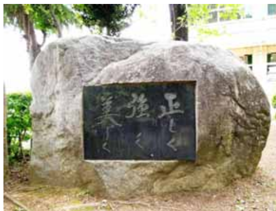
【校訓「正しく 強く 美しく」】

本校では、この校訓を各学期の重点目標に掲げ、生徒が何をすればよいかかわかる具体的な目標を設定し、常に目的意識をもった生徒の取り組みを促している。また、それぞれの学期の目標を達成した生徒を、校訓達成者として位置付けている。各学期の具体的な目標は以下のとおりである。